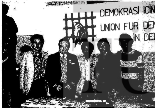
30 Nisan gecesi İsviçre'de Emek Partisi ile Gewerkschaft Sendikası'nın birlikte düzenledikleri gecede Demokrasi İçin Birlik standı... Dünya Barış Konseyi'nden Nino Pasti de DİB standını ziyaret etti.

"Ülkemiz karanlık bir dönemden geçiyor. Faşist askeri diktatörlük halklarımızı kuzaktan ayırmaya çalışıyor. Bu koşullar altında tüm yurtsever, demokrat ve ilerici güçlerin eylem ve güçbirliğini sağlayarak askeri faşist diktatörlük karşısında birleşik, örgütlü bir güç olarak tek cephe halinde çıkmakla yükümlüyük. Bu görevin bilincinde olarak görevinizi dostça selamlar, en içten başarı dileklerimizizi iletiriz."