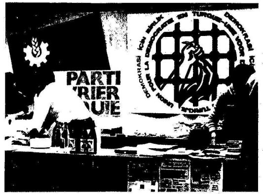
Demokrasi İçin Birlik Belçika Örgütü, 1 Mayıs'ta Belçika Komünist Partisi'nin düzenlediği gecede açtığı stand

"Kürdistanlı Devrimci-Demokrat İşçi Dernekleri (KKDK), Gerçek Gazetesi Avrupa Dayanışma Komitesi, Demokrasi İçin Birlik Federal Almanya Komitesi (DİB-FAK) olarak bu sorumluluğun bilincinde karşılıklı saygı, eşitlik ve ortak savaş ilkelerinden giderek anti-faşist, anti-emperyalist, anti-sovenist güc ve eylem birliği platformunu kurmuş durumdayız. Tüm Türkiyeli ve Türkiye Kürdistanlı demokratik kuruluşları bu platforma çağırıyoruz."