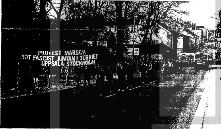
İsveç'te faşizme karşı Upsala ile Stockholm arasındaki uzun yürüyüş