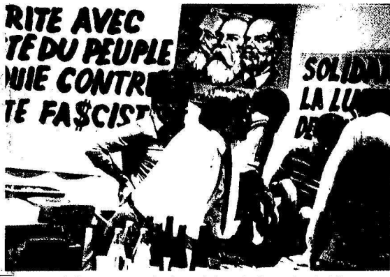
ile Belçika demokrasi güçlerini, faşist askeri diktaya karşı mücadelesinde Türkiye halkıyla dayanışmaya çağırdı.

SINIFININ SAFLARINDA, DİĞER GÜÇMEN İŞÇİLERLE BİRLİKTE BARİŞ, DEMOKRASI VE SOSYALİZM İÇİN KARARLILIKLARINI HAYKIRDILAR. DEMOKRASI İÇİN BİRLİK ÖRGÜTLERİ DE TOM OLKE VE BÜLGELERDE 1 MAYIS GÖSTERİLERİNE ETKİN ŞEKİLDE KATILARAK, GEÇEN SAYIMIZDAKI ÇAĞRIYA UYGUN ŞEKİLDE "ANTI-FAŞİST KAVGAMIZIN SESİNİ YOKSELT"İLER. BİRLİK AZMİNİ, ÖRGÜTTE BİRLİK, BİLİMSEL SOSYALİST HAREKETTE BİRLİK, ANTI-FAŞİST HAREKETTE BİRLİK KARARLILIĞINI DİLE GETİRDİLER VE HAYKIRDILAR: "HERŞEY BİRLİK İÇİN!"