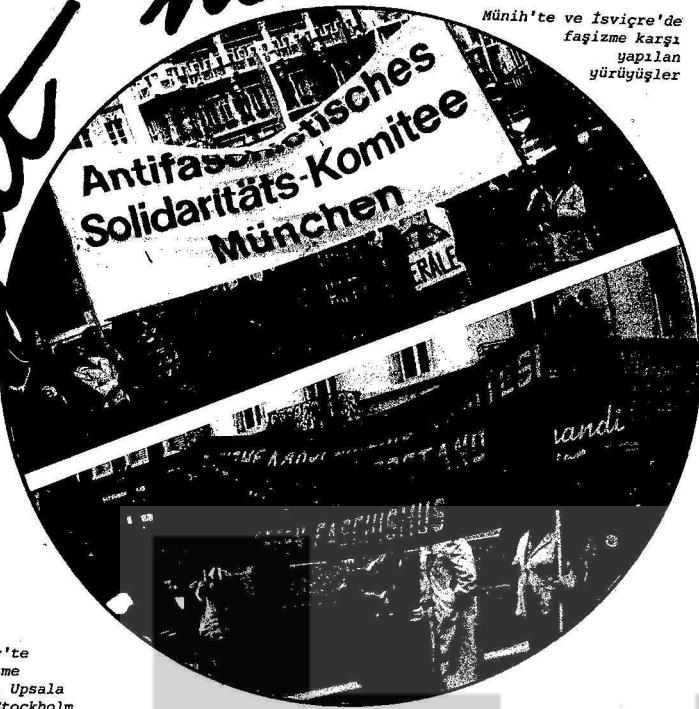
Münih'te ve İsviçre'de faşizme karşı yapılan yürüyüşler