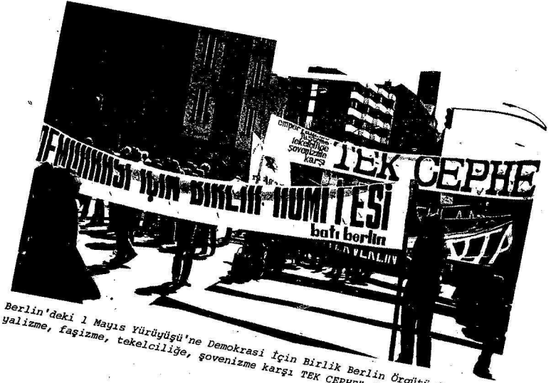
Berlin'deki 1 Mayıs Yürüyüşü'ne Demokrasi İçin Birlik Berlin Örgütü de, Emperyalizme, faşizme, tekelciliğe, sovenizme karşı TEK CEPHE' Flamasıyla katıldı.

SINIFININ SAFLARINDA, DİĞER GÜÇMEN İŞÇİLERLE BİRLİKTE BARİŞ, DEMOKRASI VE SOSYALİZM İÇİN KARARLILIKLARINI HAYKIRDILAR. DEMOKRASI İÇİN BİRLİK ÖRGÜTLERİ DE TOM OLKE VE BÜLGELERDE 1 MAYIS GÖSTERİLERİNE ETKİN ŞEKİLDE KATILARAK, GEÇEN SAYIMIZDAKI ÇAĞRIYA UYGUN ŞEKİLDE "ANTI-FAŞİST KAVGAMIZIN SESİNİ YOKSELT"İLER. BİRLİK AZMİNİ, ÖRGÜTTE BİRLİK, BİLİMSEL SOSYALİST HAREKETTE BİRLİK, ANTI-FAŞİST HAREKETTE BİRLİK KARARLILIĞINI DİLE GETİRDİLER VE HAYKIRDILAR: "HERŞEY BİRLİK İÇİN!"