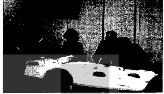
12 Eylül darbesinin yıldönümü dolayısıyla Brüksel'deki Uluslararası Basın Merkezi'nde Türkiye'de İnsan Hakları'nın Korunması İçin Belçika Komitesi'nin düzenlediği basın toplantısında Sosyalist Milletvekili Claude Dejard (soldan birinci) ve Komite Başkanı eski sosyalist bakanlardan P. Vermeulen de birer konuşma yaptı.

DİB Belçika Örgütü, 25 Ekim 1981 tarihinde Brüksel'de düzenlenen Nükleer Silahsızlama ve Barış Yürüyüşü'nün hazırlıklarına da aktif olarak katılmıştır. Yürüyüşün duyurularını