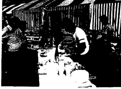
Belçika Komünist Partisi'nin düzenlediği Le Drapeau Rouge Şenliği'nde Demokrasi İçin Birlik standı ve büfesi

"ABD emperyalizmi, nükleer silahlanmayı tırmandırmanın yanı sıra, bugün, dünyanın dört bir yanında ulusların bağımsızlık ve