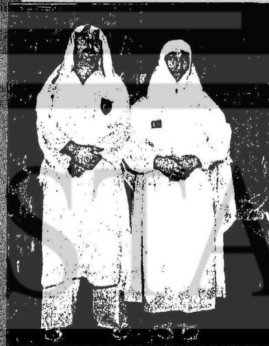
Hacı adaylarına yerine geçecek Türk hacı adayları bu yıl da bir saatlik kıyafet giyecekler. Cennetle sabah kalkacak 67 saatlik. Bu kılıfı için adaylar tüm kasabaların tozunu tozlayacak. Bu arada hava yoluna tercih eden adayların ilk bölümü dışarı gidiyor.

12 Eylül faşist rejiminin belirgin karakteristiklerinden birisi de, militarizmi ve ona koşut olarak şovenizmi hızla tırmandırmasıdır.