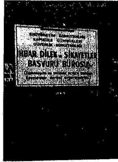
Kapıkule'deki İhbar Bürosu

Evet, Türkiye'de faşizm kurulumlaşmaktadır. Türkiye'de siyasi, ekonomik, sosyal yapılar baştan başa değiştirilmektedir. Anti-faşist kadrolar da, verdikleri tüm kayıplara rağmen, darbenin birinci yılında, her türlü abartmadan sakınarak güçlerinin sağlıklı değerlendirilmesini yapmalı; kendi dışındakilere üstünlük taslamadan, kendinde olağanüstü misyonlar vehmetmeden, eşitlik, karşılıklı saygı temeli üzerinde ilkeli bir biçimde en geniş anti-faşist birliğin, cephenin oluşturulmasına özveriyle katılmalıdırlar.