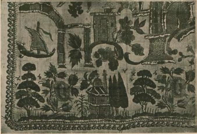
[Pek yakında Melek Celâl Hanımın "TÜRK İŞLEMELERİ" isiminde bir kitabı çıkacaktır. Bu çok kıymetli eserden parçalar ve resimler alıyoruz.]

Kerpiçten yapılmış kırk, elli evlik bir köyde fakir bir ailenin san-