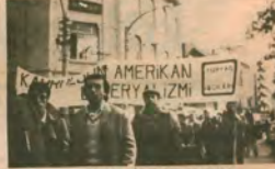
İSTA İzmir Muhabirliği

Kütahya'daki İleri gençler, örgütlenmiş gelişmesini faşist saldırılar engellemeye» diyorlar ve saldırıların korkularının büyüktüğünü gösteriyor» şeklinde konuşuyorlar.