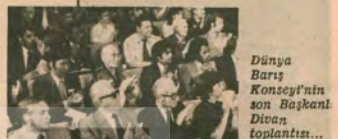
Dünya Barış Konseyi'nin açılış toplantısı...

ABD Komünist Partisi Merkez Komitesi, Çin Komünist Partisi yönetimine bir mektup gönderdi. Genel Sekreter Gus Hall'ın imzasıyla gönderilen mektupta ÇKP yönetiminin ABD emperyalizmi ile ortak girişimleri örnekler gösterilerek eleştiriliyor. Mektup şu cümlelerle başlıyor: «Birkaç yıl önce gönderdiğiniz bir telgrafta, partimizin emperyalizme karşı gevsek davranmaktasayıldığını yazdınız. Bu suçlamalar hiçbir katkıdayanmadığı gibi, gerçek dışıydı. Şimdi bizim aize, parti yönetiminize, emperyalizme iştirakli yaptığı ve onu hoş göstermeye çalıştığı için bazı suçlamalarımız var.»