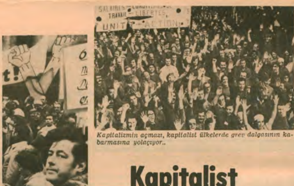
Kapitalizmin aşması, kapitalist ülkelerde grev dalgasının kabarmasına yol açıyor.