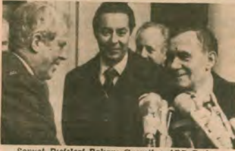
Sovyet Dışişleri Bakanı Gromiko, ABD Dışişleri Bakanı Vance ile son görüşmelerinde...