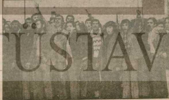
İşbirlikçi tekeliler sınıf sendikacılığını sürdürmeyecekler.

Maden-İş, onun savaşkan yiğit İye ve temsilcileri, da- ha nice çetin görevler bekli- yor. Metalurji işçilerinin, bu- güne değin sınıf karşıdeseri, emekçi halkımız, gençlerimiz, kadınlarımız, hiç bir zaman yalnız bırakmadı, bırakmayac- k. Bu dayanışma, ulusal demokratik güçlerin eylem ve güç birliği, metalurji işçiler- lerinin yeni yeni savaşım- ının utcu ulaşımında ös- nemli bir işlev görecektir. Ya- nırsa, metalurji işçilerinin savaşımını içinde edindiği tüm deneyimler, diğer sınıf karşıdeserinin, emekçi halkı- mızın savaşımına ışık tutu- yor.