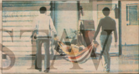
ABD,BÖLGEMİZDEN DEFOL !