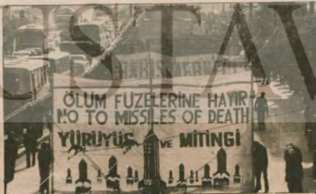
«İlerici demokratik ve barışsever güçler "Yeni nükleer füzelelere hayır" diyorlar.

ABD bölgemizden defol. Tüm sistem barmanlarıyla, tüm üleriyle ABD'yi bölgemizden söküp atınız, Orta Doğu halkları için dirimsel bir önem taşıyor.