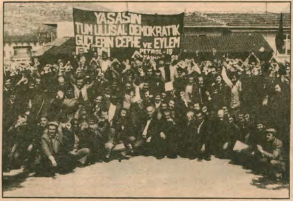
İşçi sınıfımızın ekonomik savaşını, politik savaşla ördüğü zaman başarıya ulaşır. Görev, bölücü girişimleri açığa vurmak, en geniş emekçi yığınların eylem birliğini savunmak ve bunu da işçi sınıfının ideolojik, politik savaş temeline dayandırmaktır.

İşte bu gelişmeler gerici egemen güçleri, tekeli burjuvaziyi korkutuyor. Onlar, bu gelişmeleri engellemek için, işçi sınıfının ilerici, demokratik güçlerin eylem birliğini bölmeyi ve parçalamayı DISK'in örgütsel başarısızlığını torpilleyici ve onu işçi