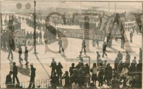
Yığıt yarısever gençler de emperyalist ölüm füzelere birlikte karşı duruyorlar.

NATO'nun ABD militarist çevrelerinin girişimleri, gerekçe bir "Sovyet tehdidi" olmadığını, tersine barış için savaşında en önde SSCB'nin yürüdüğüne, gerçek tehlikenin emperyalizmden kaynaklan-dığını yeterince göstermektedir. Bu, halkımız üzerinde anti-sovye-tizmin kırınmasında önemli bir nok-tadır. Yalnızca silah tekelcilerinin ekonomik bunalımdan kurtulmak için silahlanma yarışını dayatmış- lardan tek kârli çıkandan ke-dirleri olduğunu kanıtlamak için de önemli bir araç durumunda-dır.