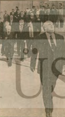
Emekçi yığınlar Amerika'nın işbirlikçi tekelci burjuvazinin büyük top rak beylerini hak adamı Demirel'in kurdugu hükümete karşı diyor.

● TOB-DER Merkez yöneticileri, Şube Başkanları Toplantısı'ndan dolayı ve Ecevit'in Kurultay konuşması ihbar kabul edilerek tutuklandı (10 Kasım) Merkez yöneticilerinden sonra TOB-DER'in 25 Şube Başkanı hakkında tutuklama kararı çıkarıldı (11 Kasım). DISK, TMMOB, TÖM-DER ve Halk evleri Genel Başkanları ortak bir açıklama yaparak, tutuklu TOB-DER yöneticilerinin serbest bırakılmasını istedikleri, ayrıca CHP'li bir kısım sayıtlar, İKD, TÖS-DER, TÜTED Ankara'daki ve İstanbul'daki birçok demokratik örgüt tutuklanmaları kinandı (11 Kasım) Bu çerçevede, DISK'e bağlı Tekstil, Hürca-İş, Lİmter-İŞ ve TÜRK-İŞ'e bağlı Petrol-İŞ ve Bagimsız Otomobil-İş baskı girişimlerine karşı çıktılar. (12 Kasım)