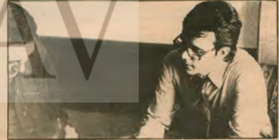
İzmir'de yapılan Dünya Gençliği ile Dayanışma gecesine katılan KNE MK temsilcisi

SAVAŞ YOLU. İşçi-köylü-öğrenci gençliğin ideolojik ve politik savaş bayrağı İYG'nin Leninci doğrultuda yeni yenileri başarılara, «daha ileri, daha yığınsal» İYG'ye ulaşacağı güveniyle, 5. yaşını kutlar.