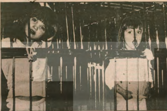
● En gelişmiş kapitalist ülkelerden Federal Almanya'da yaramaz çocukların terbiyesi. Çocuklar hayvanlar gibi kafeslere kapatılıyor.