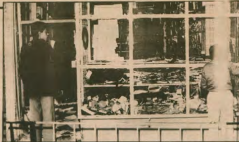
Konya'da faşistlerin koydukları bomba sonucu tahrip olan Çağdaş Kitapevi

Mahmut Bilgili — Tüm kamuoyunun bildiği gibi bombalama, adam öldürme olaylarının altında MHP ve ÜGD vardır. Suçlarının açığa ortaya çıkmasına rağmen hükümet suçlularından hesap sormuyor. Hükümet büyük bir yanlış içindedir. Konya'da Zafer Meydanını bu haline getiren faşist çetelerin neskele edilmesini talep ediyoruz. Tüm bunlara karşı kitapevine 28 kez saldırı düzenleyen MHP, ÜGD li faşistler yakalanıyor. Bu emniyetin yokluğunu gösteriyor. Suçlular bulunulmaz, MHP-ÜGD kapatılmalı sorumlularından hesap sorulmalıdır.