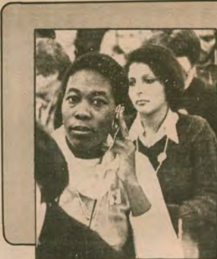
● Moskova'da toplanan Çocuk Konferansı'ndan bir an.

Dünyada 1 milyar 600 bin çocuk yaşıyor. Bu, dünya nüfusunun yüzde 30'a demektir. Bu çocuklar 3 bin farklı dil konuşuyorlar, yani 3 bin ayrı halkın çocukları... 20 yıl