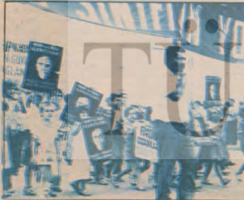
■ Çocuklar İzmir'de «MHP-ÜGD kapatılın faşist Türkler tutuklansın» diyerek; anaların, babalarının ağabeylerinin yanında saf tutular