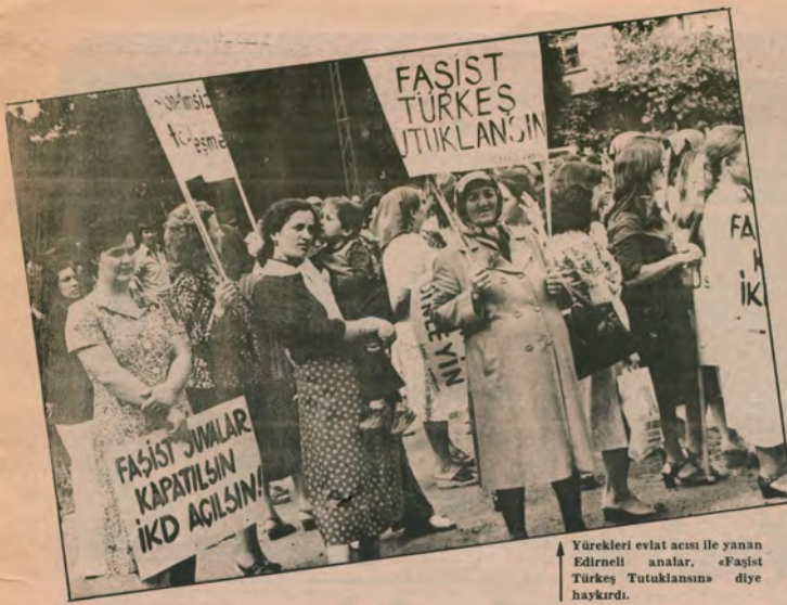
Yüksekleri evlat acısı ile yanan Edirneli analar, «Faşist Türkeshituklanşın» diye haykırdı.