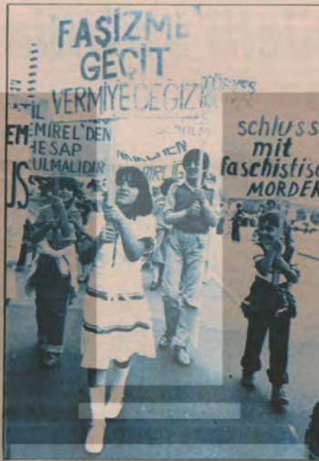
■ Antifaşist kampanya yurt dışındaki işçilerimiz tarafından da kararlı şekilde desteklendi. F. Almanya'daki mitingler büyük ilgi gördü.

Önümüzdeki günlerde mutlaka yenilmesi gereken bu suskunluk ve kaçaklık, susgun ve kaçakların zarar hanesine yazıldı.