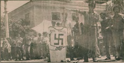
Köyler, kasabalar faşizmi protesto ediyor

Sadece büyük kentler mi? Köyler, kasabalar da katil di Faşizme Karşı Savaş kampanyasına. Torbalı ilçesinde Türkiye'nin maketi yakılırken, Yazbaşı, Kuşçuburun, Salpır, Bozköy, Çaybaşı, Özbek, Almetli köylüleri, çevre fabrikaların işçileri eylemlerde yığınsal olarak yer aldılar. Söke köylerinden, Kayseri köylerine uzandı eylemler.