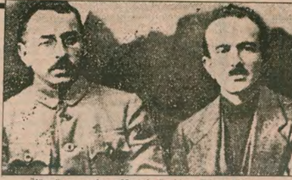
Ölümsüz savaşçılar - Mustafa Suphi ve Ethem Nejat