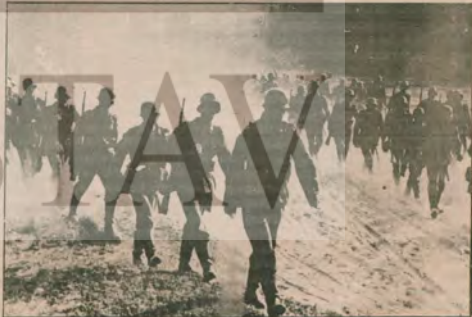
Nazilerle yenilmesi, emperyalist gericiliğin en saldırgan güçlerinin ezilmesi, insanlığın önüne yeni ufuklar açtı.

1 Eylül dünya barış günü, tüm barışçı insanlığa, tüm dünya barış güçlerine kutlu olsun.