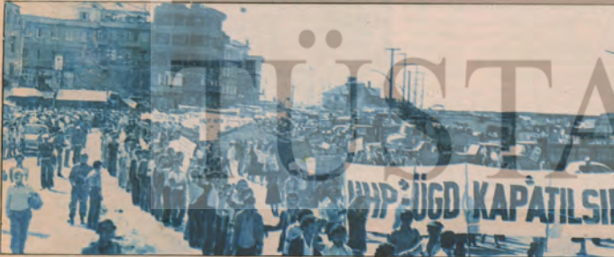
■ Antifaşist savaşçıların tüm yurdu saran belgisi Trabzon da da yankılandı. Alanlarda faşizm lanetlendi, onunla savaşacak güçlerin azmi bin

kat daha güçlendi. MHP-ÜGD Kapatılsın, Katil Türkeshituklanşın belgisini yükselten Trabzon 'lu savaşçılar şimdî daha kararlı, daha bilinçli