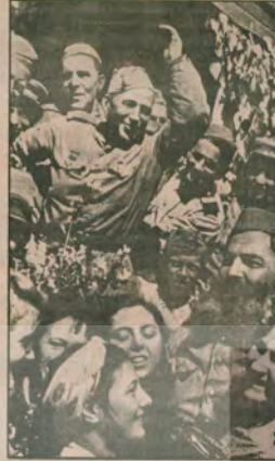
20 milyon şehit veren Sovyet halkı «Barış» böyle karşılama.

Dünya Barış günü, tüm barış güçlerine kutlu olsun