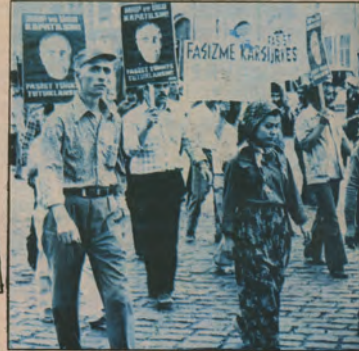
18 - 24 Ağustos Faşizme Karşı Savaş eyleminde. İzmir ratarların ortak İstemi «MHP-ÜGD Kapatılsın, Katil TB Delaylı, dolayız baskılara ve tüm olumsuz tavırlara faşist savaşçıların kararlılığını dostu düşmana bir kez