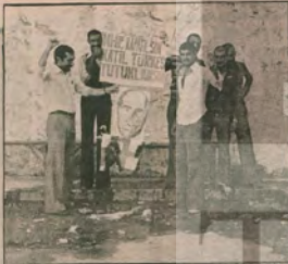
Faşizme karşı savaşımı cezaevlerinde de sürdürü

Pazar yerleri, yağ kuyrukları, mahalle araları, alanlar, her köşe, bir faşizmle savaşım alanıdır. Büyük kentlerde demokrasî savaşçıları, tüm büyük pazar yerlerinde eylemlerini sürdürdüler. İşte İstanbul'da, Ortaköy Pazarında yapılan eylemden bir görüntü.