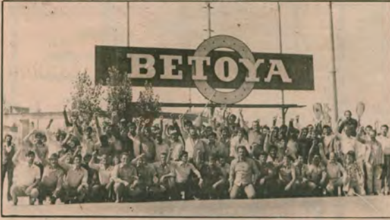
BETOYA İŞÇİLERİ işçi sınıfı dayanışmasının en güzel örneğini veriyorlar.