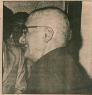
TKP MK Genel Sekreteri I. Bilen