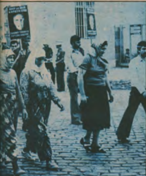
emekçi halkın, tüm yurtseverlerin, demokrasî tutaklarının beğenildi alanlarda yankılandı. Başarıları ile gerçekleştirilen eylem, anti-faşist gösterdi.

arak, işçi sınıfının politik örgütü ve şoyumuz işçi sınıfının politik örgütü, ve şoyumuz işçi sınıfının yoludur diyen demokratik örgütler, kuruluşlar, küçük hesaplarla, sudan bahanelerle, tutarsız gerekçelerle soğutulmuş istendi! Bu olumsuz ve faşizme karşı savaşın en temel ilkelerini kavramayan tavır en tutarlı ve en yığıt antifaşist savaşçıları olduklarını kanıtlayanları eylemlerini kararlılıklarını bir adım daha gerlettiler. Ne var ki, faşizme karşı daha yığınsal, daha birlikteli ve daha caydırıcı güçle çıkılmasına bir ölçüde engel oldu. Bundan yararlanan ise sadece ve sadece faşist odaklar ve onları korumaya çalışınlardı. Faşizme karşı güç ve eylem birliğinin ne bahasını olursa olsun sağlanmasının tüm yollarını denemek, tüm boyutlarını zorlamak, eylem birliğini ne bahasına olursa olsun sağlamak, önümüzde, günün en canalıcı sorunu ve görevi olarak duruyor.