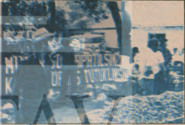
"MHP-ÜGD Kapatıl-sın, belgisi kentlerde semt-semt yankılandı