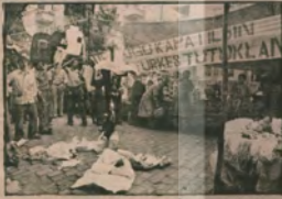
Her köşe faşizm ile savaş alanıdır

«ÜGD kapatıl-sın, faşist yuvalar dağıtıl-sın, can güvenliği sağlansın» istemini haykırıldığı bir alan oldu.