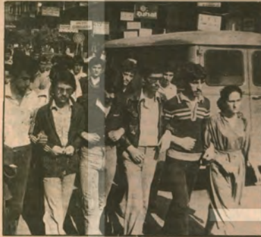
İlerici gençler, olayı protesto için yürüyorlar: Tutuklanılanlar onlar oldu...