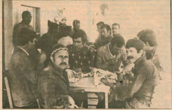
Atılan arkadaşları için boykota geçen işçiler «Beton-İş Onurumuz» diyor...

emekçileri işbaşı yapmayacaklarını açıkladılar. Metre- küp başına verilen zammı ya- şam koşullarının ağırlığı kar- şısında kabul edemeyecek- lerini söyleyen Çeltik Orman Kooperatifi Başkanı, direni- şin sürebileceğini bildirdi. Bartın Belediye İşçileri ise üç aydan beri süren toplu