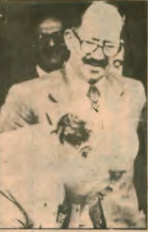
KEPTİOĞLU AP'de - Yeni transfer bedelleri utanc vericidir.

lanma sağlanmadan son darbeyi vurmaya yöneliyordu. Öte yandan, çeşitli davalarla, faşist terör odaklarıyla ilgili olarak yürütülen soruşturmalara sonuna gelmeye başlamış, faşist odakların ve onların MHP gibi resmi kuruluşlarının suçlulukları artık ne yapılsa yapılmış güdülerden gizlenemez olmuştğu. İş sona varamadan, kırıl çamaşlıklar büsbütün ortaya serilmeyen, bu davaların ve suçların örtülmesi gerekemeydi. Nihayet, son gelişmeler bir streddir görebilir hareket sizlik ve bekleyiş içinde olan yığınları harekete geçirebilecek nitelikteydi. Egemen güçler arasında bu hareketlenmenin de mutlaka önlenmesi gerekiyordu.