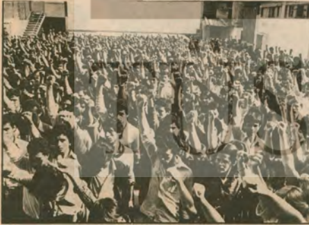
Yığınlar, faşist saldırılara, reformizm ve sağ oportünizmin çabalarına rağmen tereddütsüz ve harçketsiz kalmışlardır.

Demirel'e sözcüsünü bu lan, Hükümeti yıkımaye yö nel çabalarını son günler de yoğunlaştırılmış olma - sının nedenleri vardı: Bir - rincisi, IMF'le ülkenin ba - ğımsızlığı bahasına da ol - sa bir anlaşmaya varıl - mıştı. Bunun bazı sonuç ve ünlere gözlenecek, yi - ğınlar ezilise bile, alınan ekonomik önlemlerle CHP ağırlıklı hükümet büyük sermayenin sızlanmaları - nın önüne kısmen geçebi - lecek, meclisin tatil girdi ki ği günlerde hükümete ka - labilecek hatta bu kısa dö - nenden yararlanarak, bel ki de kendini toparlayabi - lecekti. Demirel'in sözcü - lüğünü yaptığı, hükümeti mutlaka dağıtmaya ve ye - rine faşizan bir hükümet modeli geçirmeye kararlı çevrelerin acelesi, bu topar