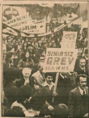
İşçi sınıfı safalarında birlik olmazsa buna sadece burjuvazi sevinir