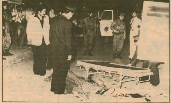
Faşist cinayet sebel-herinin kanlı saldırılarının sonucu: 3 ölü, 5 yaralı...

Bakırköy Halkevi'ne bombalı saldırının üzerinden neredeyse üç hafta geçti. Bombayı kim attı, neden attı, neden en kalabalık bir sarte kolleği gibi soruları sormaya bile gerek yok. Bakırköy Halkevi'ne çevrede kimlerin düşman olduğu apaçık biliniyor.