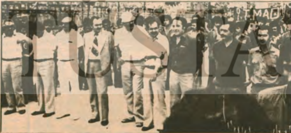
Maden-İş ve Bank-Sen yöneticileri yanyana...

İzmit Yürüyüşü ve Miting'i hiç kuşkusuz 1 Mayıs 1979'da İzmir'de kutlanan 1 Mayıs törenlerinden sonra yılın en yığınsal eylemi oldu. Dar grup çıkarılmıyan batıdaki anarkomünizm yanlıları, İSK yönetimini tasliylecek politikasına alkış tutanlara derslerle doluydu İzmit'teki yığınsal eylem. Aynı şekilde durmadan sağa açılan CHP hükümeti, işçi sınıfının, demokrasinin güçlerinin, sağ sosyalizminin burjuva ve reformizminin kuruyunda değil, işçi sınıfının bağımsız politikasının yürütülmesinde savaşacağını bir kez daha gördü.