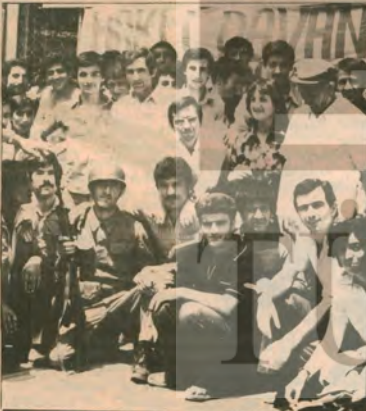
İşçiler hareketstliklerini dinlerleri kırım - Son 15 yıldır işçi ve emekçileri pasifize etme çabaları hedefe ulaşmadı. Yeni dönemde birlikte gr evler birbirini izliyor. Rosimide grevdeki Söm bank işçileri İleri Gençlerle birlikte.

YİĞİNLAR HAREKETLENİRKEN Gerektikçe de, Haziran ayının sonlarına doğru, emekçi yığınlarla ve demokrasist güçleriyle, bir süredir bu oranda belirgin-