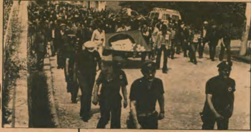
Kamburğu'na sıklıkla 14 kursun, İGD'li gençlerin Faşizme karşı kinini daha da bildi...

● Son günlerde artarak devam eden faşist saldırılar yer yer emniyet örgütlerinden ve devlet aygıtına sızdıran faşist kadrolardan büyük ölçüde destek buluyor.