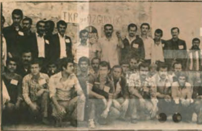
İşçi sınıfının savaşçılarını, seslerini Cezaevlerinden de yükseltti...

Olay üzerine, ilericiler sendikalarını, melek ve kitle örgütlerini, gençlik örgütlerini bulundukları 45 demokratik kuruluş yayınladıkları bildiride olayı kınadılar, maoculara Türkiye'nin bu tür davranışlarına, ortak hedefleri için ortak davranışları için ziddikertini bildirdiler.