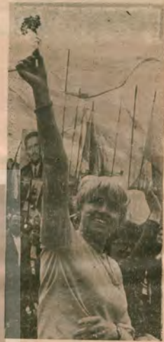
Sosyalist ülkeler 1 MAYIS'ı Uluslararası dayanışma belgileriyle kutladılar...

YUNANİSTAN'da 1 MAYIS kutlamaları 1 hafta kala