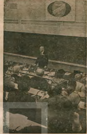
Barış Güçleri Dünya Forumu'ndan (Moskova 1973) bir görünüşü. Sovyet Barış Komitesi İkinci Başkanı Filyodor konuşuyor.

Bağlantı Forumu Viyana'daki tüm ulusal uluslararası örgütleri, tanınmış kişilerle ilişki kurma görevini verdi.