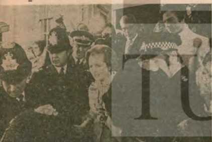
Thatcher İktidarı'nı İşçi Partisi'nin sağa kayışına borçlu...

İngiltere'deki seçim sonuçları, sağ sosyal demokrasî-nin ikizimini ve yığınların güvenini adım adım nasıl kaybedeceğini açıkça gösteriyor. Türkiye'nin NATO'cu, antikomünist, emperyalizm yudusu tekeli sermaye çev-releri ve sözcüleri ise sonuçtan memnun görünüyorlar.