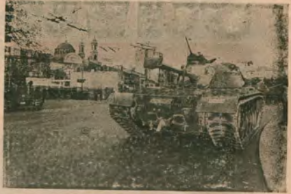
1 Mayıs'ta İstanbul sokaklarında sokağa çıkma yasakla birlikte olağanüstü güvenlik önlemleri vardı.

Hükümet sıkıyönetim oylamasında da düşmüdü. Ancak çoğunluğu kaybetmişti ve sallandıydı. 1 MAYIS'ı böyle bir ortamda yaptıkları: Faşist tirmanış faşizme dönüştürmeye bölezen kimileri ileri 1 Mayıs bulunmaz fırsatı. Ordu içinden bir darbe şoylentierinin yabancı gazetelerle görüldüğü bir dönemde, büyük olaylara ve kan dökülmesine neden olacak bir 1 MAYIS hem hükümeti götürür, hem de faşizmi yaklaşıtırdı.