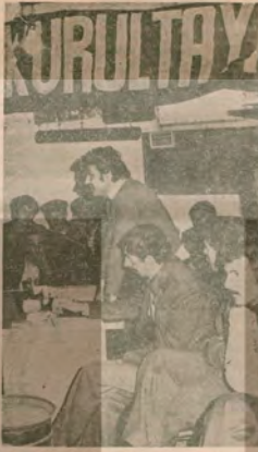
Marmara KÖY-DER'in düzenlediği, Marmara Köylüleri 1. Tütün Etkileri Kurultayı Sıpal Köyünde toplandı.

Marmara Köylüleri Dayanışma Derneği (Marmara KÖY-DEB) tarafından düzenlenen Tütün Üreticileri 1. Kurultayı, AP'li İnegözü Belediyesi başkanının, CHP sağ kanat yöneticilerinin ve idari makamların çeşitli engellemelerine karşın İnegözü'nün Şıbal köyünde yapıldı ve kooperatiflerin tek bir çatı altında toplanmasını teklilere karşı köylülerin eleme bir savaş silahtı olacağı vurgulandı.