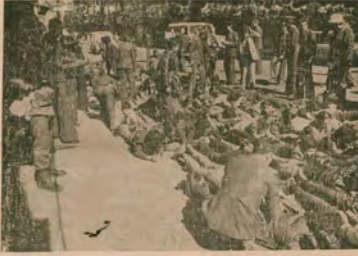
Istanbul'da sembolik protestolar bile şiddetle bastırıldı.

1 Mayıs'ın kutlanması işçi sınıfının hiçbir zaman ödün veremeyeceği bir konudur. Ama 1 Mayıs soyut bir kutlanmadır ibaret değil. 1 Mayıs, öncelikle sınıf savaşımının bir anı, bir biçimidir. 1 Mayıs Türkiye koşullarında, faşizme, emperyalizme, işbirlikçi tekelci burjuvaziye karşı bir savaşıdır. Bu nedenle 1 Mayıs kutlamaları, sınıf savaşımının içinde bulunulan aşamadaki görevlerine, sınıf savaşımının strateji ve taktiklerine bağlıdır. 1 Mayıs kutlaması, Türkiye somutunda, işçi sınıfının ve bağlaşıklarının devrim hedefine doğru giden yolda atılması bir adımdır. Bu somut koşullarda ve hedeften soyutlanıp da 1 Mayıs sıradan bir kutlamaya ve gövde gösterisine dönüşür. Bugün her devrimci, herlika çaba, her eylem, her kutlamaya, kısaca her devrimci girişim önce bu amaçla yığın savaşımının geliştirilmesi, yaşamını gözlemek zorundadır.