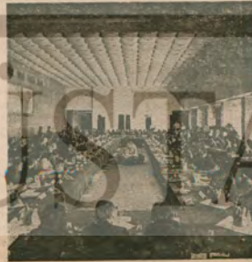
Dünya Barış Konseyi'nin Şubat 1977 Sofya toplantısından bir görünüşü.

Dünya Barış Konseyi'nin en büyük barış forumu olan bu kongreye, 143 ülkeden, 120 uluslararası örgütün, 1100 ulusal örgütün 3500 delegé katıldı. Leonid Brejnev tarafından açılan konferans, Barış Güçlerinin Uluslararası