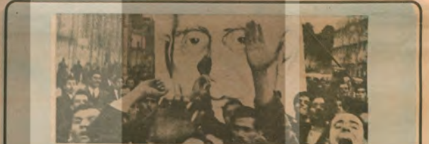
1953 Martında Mussadık hareketinin nereye varacağı ortaya çıkmıştı

Görüldüğü gibi, emperyalizm, gerici faşist güçlere ve onların masası maoelülüğe karşı ulusal demokratik güçlerin birliği, örgütlü savaşımı yeni Endonezya katliamlarına yol açmamamın on koşullarındandır. Endonezya katliamlarının benzerlerinin yaşanması, ulusal demokratik güçlerin birliğine, örgütlülüğüne ve maoeracı kamillerine bağlıdır.