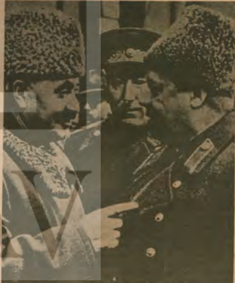
Stambolski ve sosyal demokratlar, cepheden kaçıp faşizme peçit verdiler. Ama Vatan Cephesi, faşizmi ezdi ve 1948'de Georgi Dimitrofu, başbakanlığı seçti.

Ancak 1936 yılında Bulgaristan'da antifaşist cephe kuruldu. Bu cephe, çeşitli evrelerden geçerek, Bulgaristan halkını sonuçta başarıya ulaştırdı.