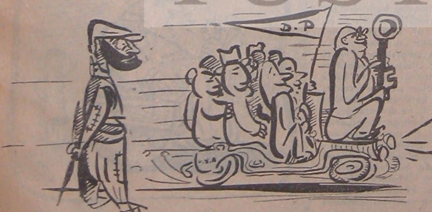
Köylü — Demirkir - at dedikleri buymuş dimek?!