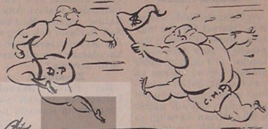
Partiler arası bayrak yarışı