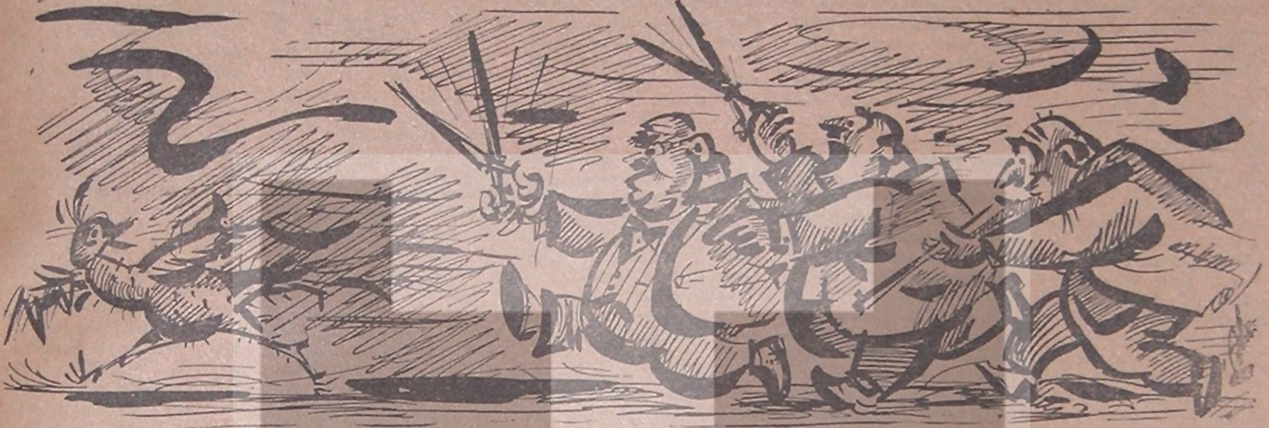
Af Kanununun kuşa benzetmek istediklerinin resmidir...