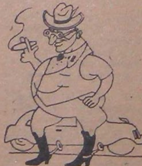
Köylü Gençlerimizin hali