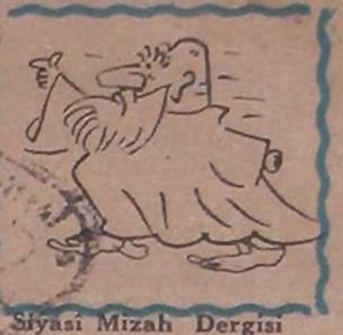
Siyasi Mizah Dergisi