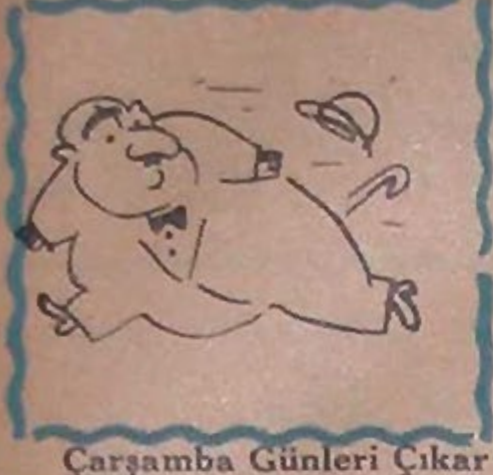
Çarşamba Günleri Çıkar