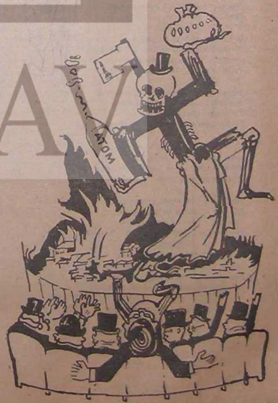
AVRUPA KONSEYİNDE ÖLÜM DANSI...