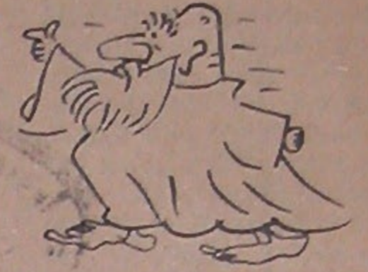
Siyasi Mizah Dergisi