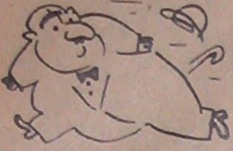
Çarşamba Günleri Çıkar