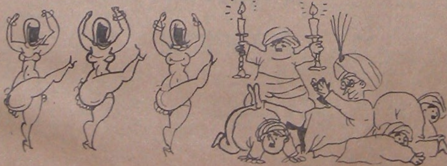
Turistlerin istirahatı hur-gizlerin rakıkları ile şenlendirilecek.

Ortadoğu çöllerinde (her cilli adında bir) özel huriler tarafından, ücretli mukabilinde abi kevsir satılacak.