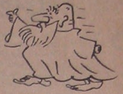
Siyasi Mizah Dergisi