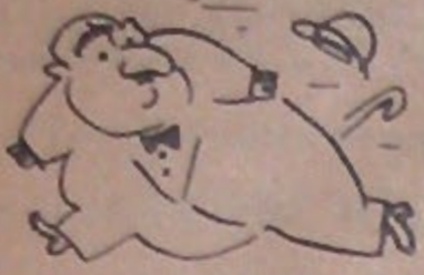
Çarşamba Günleri Çıkar