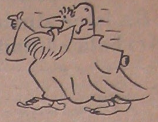
Siyasi Mizah Dergisi