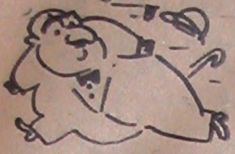
Çarşamba Günleri Çıkar