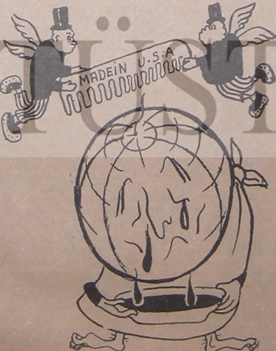
Kel başa «NAYLON» tarak

Eski kitap ve gazeteleri karış- tırmayı bilmem sever misiniz? A- rasıra bunlara göyle bir göz at- mak faydalıdır. Geçen gün Recep Pekerin 1934/35 ders yılında An- kara ve İstanbul Üniversitelerin- de okuttuğu ve 1936 da Ulus mat- baasında bastırıldığı İnkılab Ders- leri Notları adlı kitabını karıştır- yordum. Kitabın «Dokuzuncu Ders» adlı son bölümü «İstiklâl» mevzuuna ayrılmış. Peker'in bu mevzuda neler demiş olduğunu me- rak edip okudum. Okudukça şaş- tım, okudukça dehşete düştüm. İstiklâl hakkında söylemiş bütün cümleler Truman doktrini ile Mars hall planı gereğince imzaladığı - miz her iki anlaşmanın hiçbir maddesine uymuyor. Peker, Ame- rikan yardımına vermiş verişti- miş. Hâlâ hayret ediyorum, Ame- rikan yardımı aleyhinde bu kadar