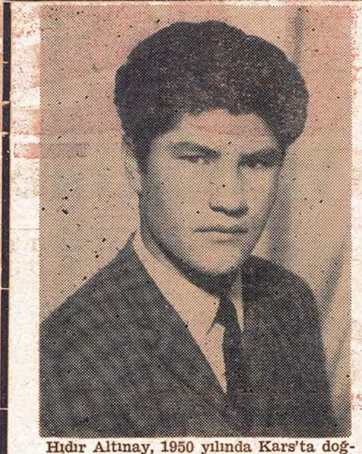
mustu. Bir proleter olarak halkımızın emperyalizm ve köpeklerine karşı vermekte olduğu mücadelede yerini aldı.