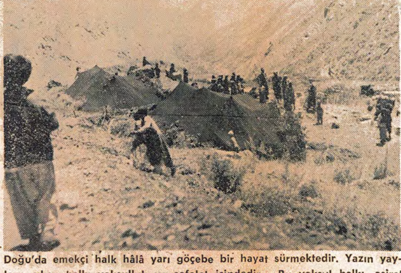
lava cıkan halk, yoksulluk ve sefalet içindedir. Bu yoksul halkı, aşiret reisleri, şeyhler ve ağalar ezerken, Amerika ve işbirlikçisi iktidar da komando zulmünü vürütüvor

Gecenlerde Gülsehir'de büvük bir köylüler mitingi düzenlendi. Devrimci gencler köylülerin bu mitingi için ellerinden gelen yardımı yaptılar. Köy köy dolaşıp, miting haberini vavdılar Kövlülerin iktievimizi de basımıza vıkarak sürüp sını hazmedemeyen gericiler bir