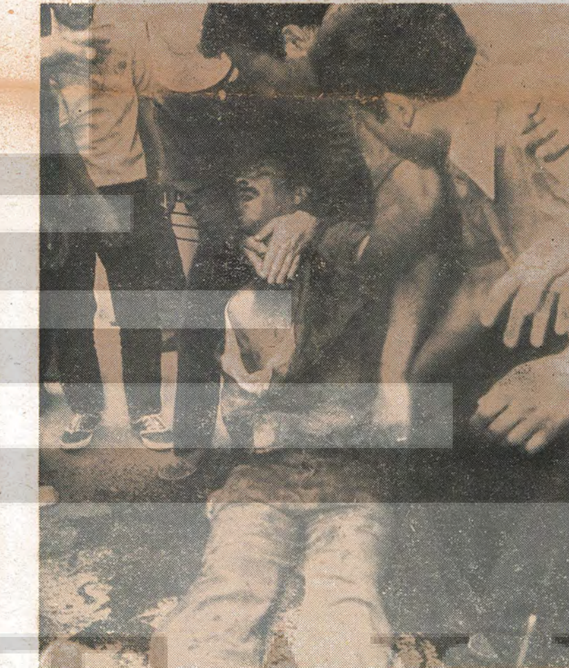
16 Haziran'da vurulan işçilerden biri

Emperyalizm - İşbirlikçi patron - Ağa iktidarı bizi ezemez. Biz milyonlarız, onlar bir avuç