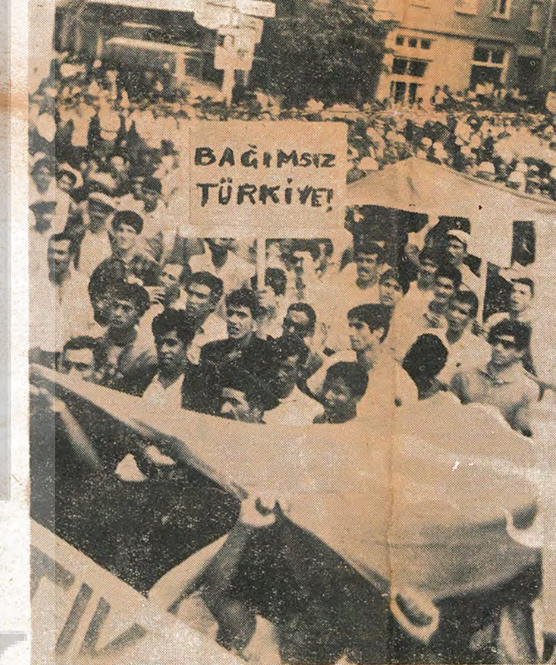
Gaziantep'te emekçiler, bütün engellemelere rağmen köylülerden bir çığ gibi inerek şehrin büyük alanını doldurdu. Binlerce üzümlük ve fıstık üreticisi heybetli mitinginde «kahrolsun tüccarlar», «kahrolsun ağalar», «kahrolsun Amerika» ve «Bağımsız Türkiye» diye haykırarak...

«Kavgada vuruldu dağ gibi düştün Duyuldu zelzelen dört bir tarafta...»