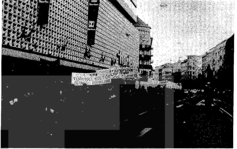
YÜRÜYÜSTEN BİR GÖRÜNÜŞ.

biz de Gelsenkirchen Türk İşçi Derneği olarak katıldık. Fakat kaç kişi ile? Bu rakam yürekler acısı, 35 kişi ile. Evet yanlış anlamadınız sade