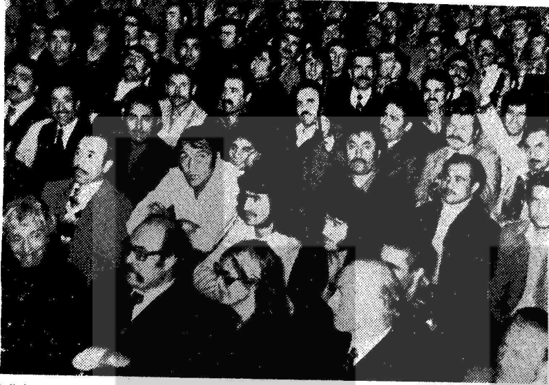
Prächtige Stimmung auch ohne Tanz und Alkohol: 800 Türken im großen Saal des Hans-Sachs-Hauses.

chen ve Çevresi Türk İşçi Derneği'nin ortaklaşa düzenledikleri gecede seyircilere folklor ziyafeti çekildi. Türkiyeli işçiler kadar Alman davetlilerinde ilgiyle izlediği "Pusuda" piyesi, Türkiye'nin bugüne kadar süregelen en büyük dertlerinden Ağa ile Köylü yaşantısını gözler önüne serdi. Gecede ayrıca Gelsenkirchen ve çevresinde ki işçiler içinden yetişen "Halk Ozanları" saz ve sözleriyle kendi yaşantılarını dile getirirken bol bol alkış topladılar. Programda gösterileceği vaadedilen Yılmaz Güney'in AĞIT veya ÜMUT filmleri elde olmayan sebeplerle getirilemiyince yerine sanatçının başka bir filmi gösterildi. Olaysız ve dostane bir şekilde 6 saat süren geceyi 800'ün üzerinde seyirci izlemiştir.