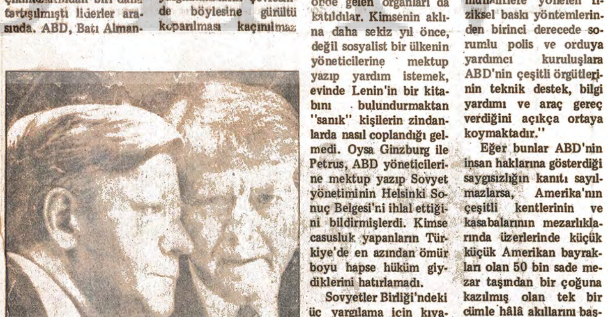
Alman Başbakanı Schmidt ve Boşkan Corter Hür Dünya"nın esir tüccarları...

tısından beri dünya ka- leyen büyüklü küçüklü sa- Batılı basın yayın or- ayaklar altına aldıkları