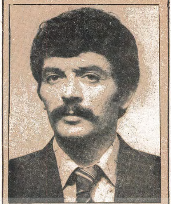
Yücel GÜRSEL İstanbul Küçükyaşı Belediye Başkanı

1941 yılında İzmir'de doğan Yücel Gürsel, beş çocuğu bir iş ailesinin çocuğudur. Çalışma hayatına orta öğrenimden başlamış, yüksek öğrenimini de çalışarak kendi emekleriyle tamamlamıştır. Y. Öğrenim yaptığı Devlet Güzel Sanatlar Akademisinde 1969 yılında öğrendiği dereği başkaları ve öğrendiği temsilciliği yapmış, 1972 yılında Mimarlık bölümünden mezun olmuştur. 1973-74-75 yıllarında Mimarlar Odası İstanbul Şubesi Sekreterliği yapan Yücel Gürsel, teknik elemanların mesleki ve örgütsel maddelerinde etkin çalışmalarında bulunmuştur. Halen Mimarlar Odası Merkez Yürütme Kurulu 2. Başkanlığı ve Mühendis ve Mimar Odaları İstanbul Koordinasyon Kurulu Sekreterliği görevini sürdürmektedir. TİP Merkez Komite Üyesi, İstanbul Şubesi Üyesi'dir. bazı örnekler, birkaç ileri belediye başkanının yaptıkları ile görülmüştür. Ancak sermayenin iktidarı CHP bunları bile tahammül edememizi. Çünkü bu çaresizliklerin kader ortada çıkmaktadır. Bu kavrayan milletlerci duruma karşı, KADERİMİZİ GİBİ GÖSTERMEYE ÇALIŞIYORLAR. Bugünkü koşullarda bile, kent halkının, kentlerin sorunları temelinde çözümlenebilir, böylece araları önceden kapatan arsa spekülasyonları bazı örnekler, birkaç ileri belediye başkanının yaptıkları ile görülmüştür. Ancak sermayenin iktidarı CHP bunları bile tahammül edememizi. Çünkü bu çaresizliklerin kader ortada çıkmaktadır. Bu kavrayan milletlerci duruma karşı, KADERİMİZİ GİBİ GÖSTERMEYE ÇALIŞIYORLAR.