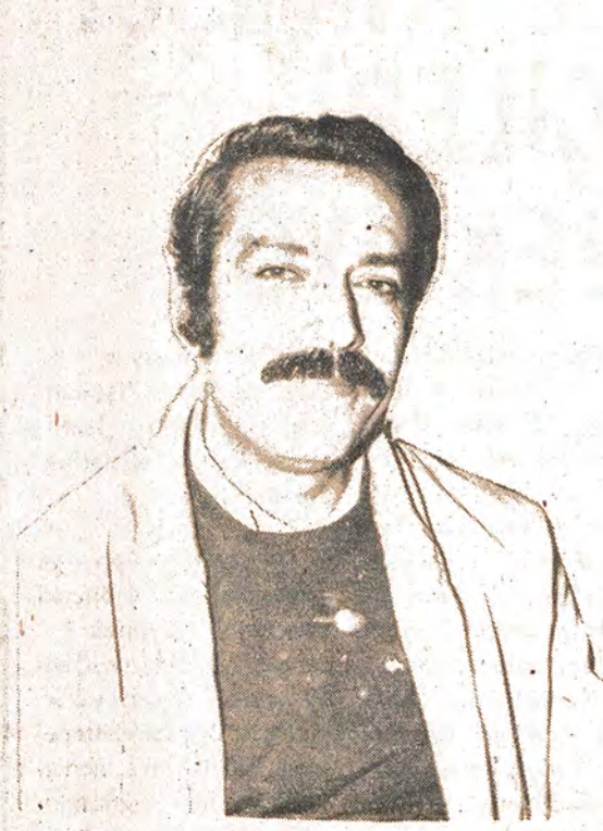
Engin OMACAN İstanbul Kağıthane Belediye Başkanı