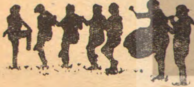
(3. Sayfadan devam)

Temelden çıkarak hayatta tek sahibi olduğu eski yorganına doğru yürüdü.