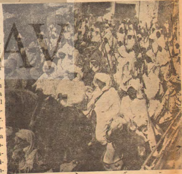
İşte Cezayir örneği!.. Cezayirliiler, ezenlere başkaldırırken Mustafa Kemal'i örnek aldılar..

(*) Bir şeyin gerçek sahibi (maliki) ile o şeyi elinde bulunduran kişi, kişiler (zilyed) ayrı olabilir. Hukuk alanında yürürlükte olan zilyedlikle iktisap kuralı toplumsal plânda geçerli olmamaktadır. Zilyedler, hakları, özgürlükleri, erkleri maliklere bırakma zorunluğunda kalmaktadırlar. Bu nedenle, bizce, «iktidar sahibi» terimi çok kere yanlış kullanılmaktadır.