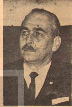
Mehmet Ali AYBAR — Mesajı sansür edildi — SANSÜR EDİLEN YILBAŞI MESAJI

«DİSK, işçi sınıfının ekonomik, sosyal, kültürel kalkınması ve yücelmesi için çalışacaktır. Konfederasyonumuz Anayasamızda öngörülen dönüşümlerin mutlaka gerçekleştirilmesine hizmet edecektir. İşçi sınıfının hizmetinde, Türkiye'nin her bakımından tam bağımsızlığı, özgürlüğü ve mutluluğu ile yola çıktık. Zaferimiz, Türk emekçi halkının zaferi olacaktır.»