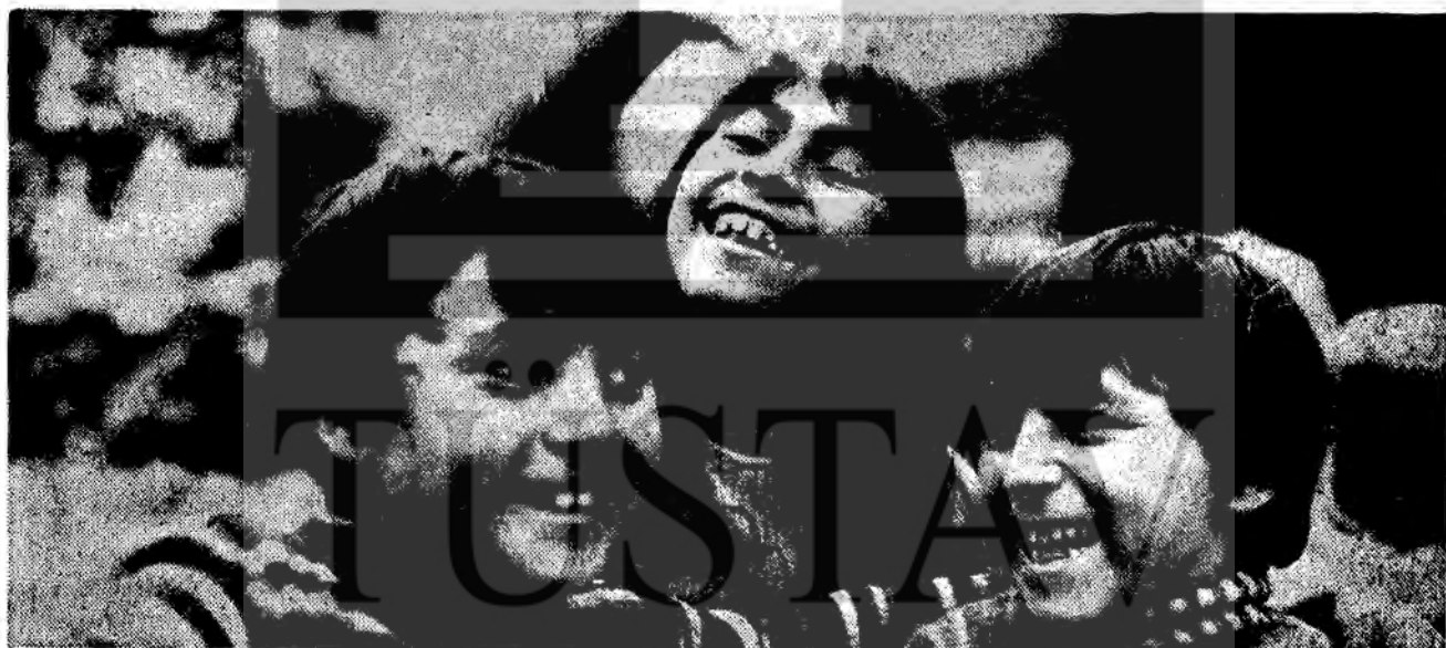
TÜRKENKINDER in der Bundesrepublik: Zwischen Aufklärung und Koran-Schulung.

So gesehen erscheinen die oben zitierten BILD-Meldungen in einem anderen, etwas weniger menschenfreundlichen Licht. BILD berichtet über "viele Kinder", die "nicht mehr in die Schule gehen". Wieviele es z. B. in NRW waren, sagte ungefähr zur gleichen Zeit das Statistische Landesamt von NRW: fast jeder 3. Ausländer im schulpflichtigen Alter bleibt dem Schulunterricht fern. (Nachzulesen im GEW-Organ "Erziehung und Wissenschaft" 7/77, Seite 3) Dabei handelt es sich aber keineswegs nur um Türkenkinder. Der Schulbesuch etwa bei den italienischen Kindern liegt erheblich niedriger. Kommen auch sie nicht, weil sie Korankurse besuchen? Im übrigen stellt das Statistische Landesamt fest, daß der Schulbesuch der ausländischen Kinder in den letzten Jahren nicht ab-, sondern zugenommen hat.