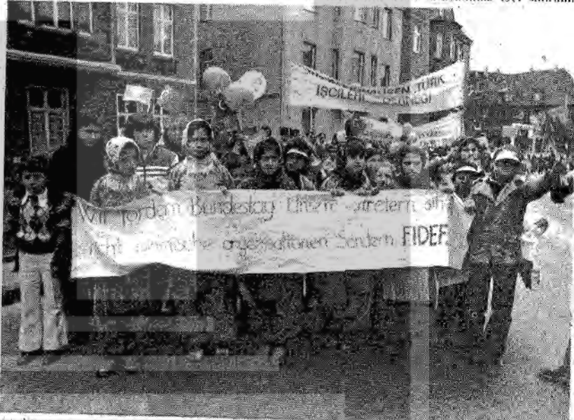
19 Nisan günü Federal Parlamento'nun açılış komisyonunda "Yabancı İşçi Çocuklarının Durumu" konulu oturumda FİDEF 'de söz alarak Eğitim konusundaki görüşlerini belirledi.

"Tercüman" işte bundan dolayı FİDEF'e saldırılmaktadır.