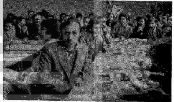
Aachen Genel Kurulu'ndan bir görünüş

Toplantı başlarken kapıya üşüşen, arkadaşları- mızın çok iyi tanıdığı birkaç faşist ve bozguncu zorla içeri girmek istediler. Zorbalıklarının sök- mediğini görünce olay çıkarmaya çalıştılar. Aachen'lı yurtseverler faşistlerle aynı tutum içi- ne girmiş bu bozguncuları aralarına sokmadılar. Maoculuğun atılan her ileri adıma karşı faşist- lerle aynı saflarda yer aldığını bu gözlem yeni- den kanıtladı. İşçi düşmanı akımların maskesi Aachen'da bir kez daha indirildi.