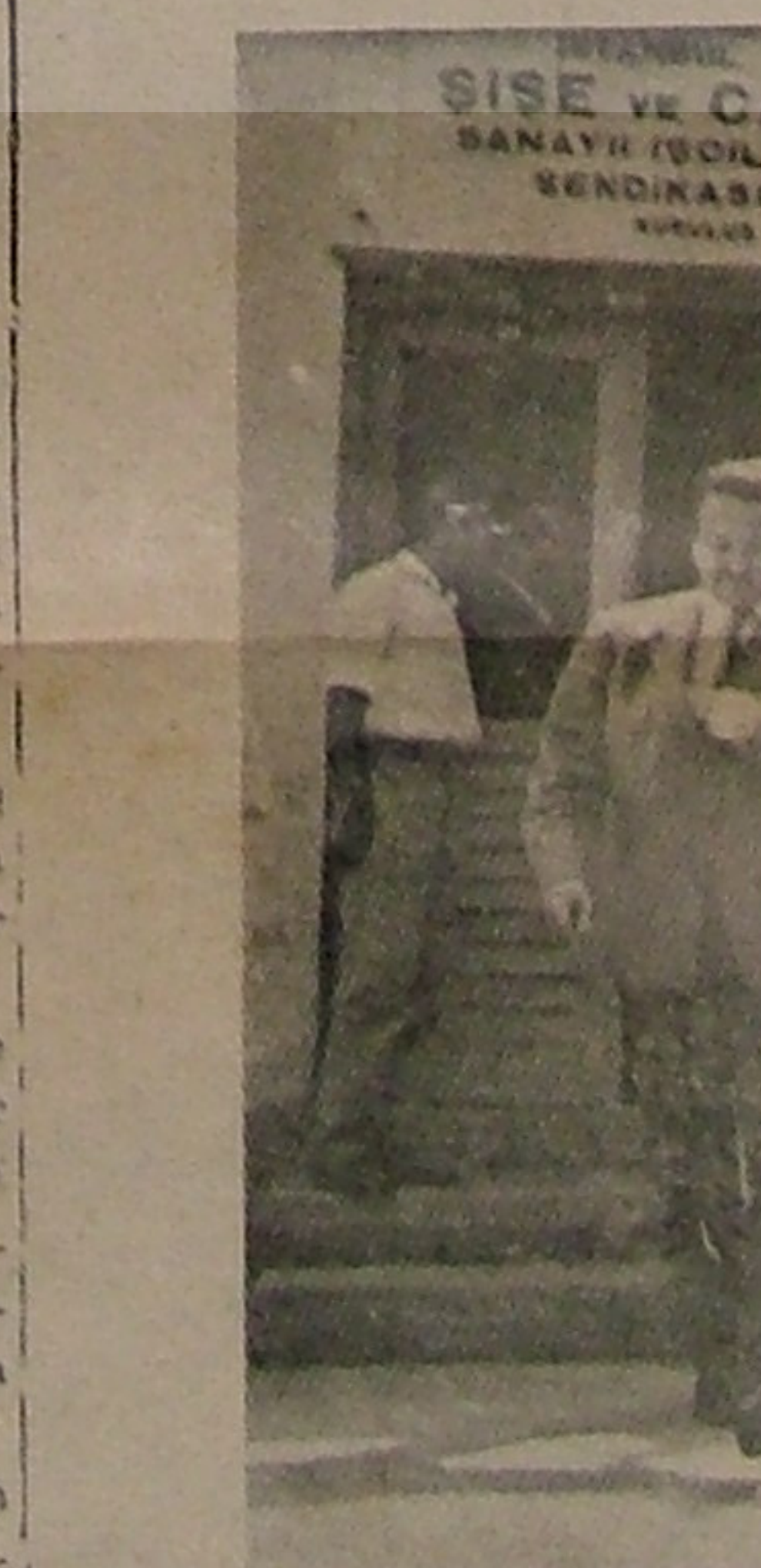
Şahap Kocatopçunun Sanayi Vekilliğine teşin edildiği sırada sendikamıza veda ziyaretini esnasında

İzmit Sendikalar Birliği Başkanı İbrahim Çetkinin divana derasyonu Münessiller Meclisi nin bu toplantısı önemli bir devreye rastlamıştır. Grev ve toplu sözleşme halâjıyla gırcığımız ye ni bir çalışma düzeninin esiginde bulunuyoruz. Bu yeni düzene gırcerken ayrıca çalışma hayatımıza ilişkin başka konuların da yeni den ele alınması gerekmektedir. Böyle bir düzene geçerken 1954 len beri toplanmamış olan Çalışma Meclisinin yeniden toplanmasında fayda ve hattâ zaruret görülmüştür.