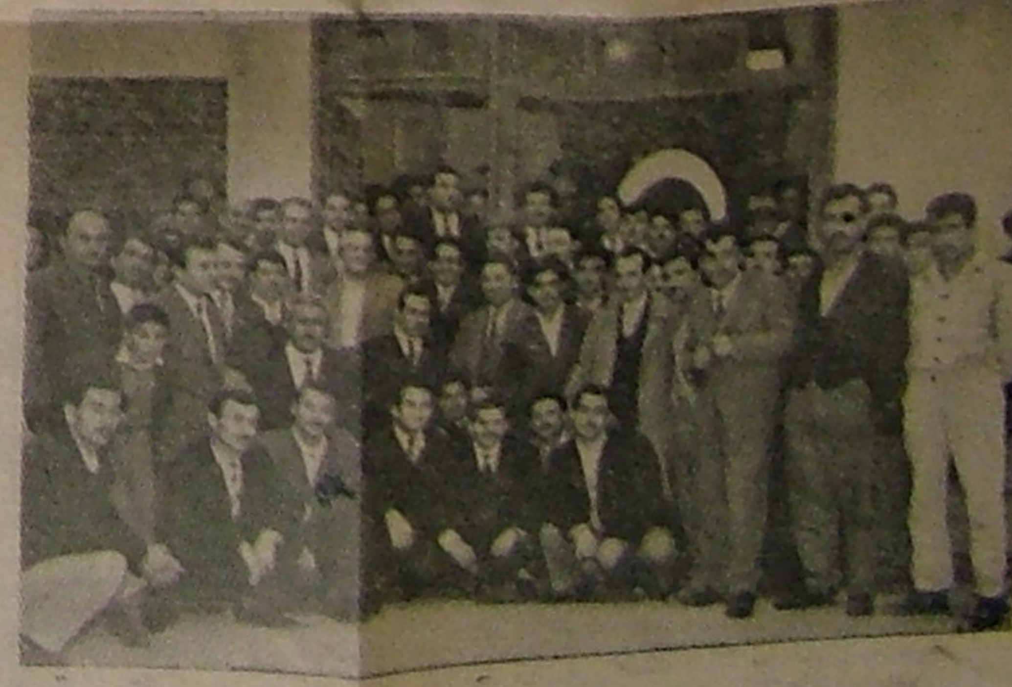
Çayırova şubemizin açılış me'asiminde Merkez Sendikadan da katılabilmiş bir işçi toplantısuhazir bulunmuştur. Resim Çayır ovardaki topluluğu göstermektedir.

Muhterem arkadaşlarımız: Sizlerin pek çok dert ve dava larının olduğuna bende hakikaten inanıyorum. Bu dert ve davaları ancak karşılık olarak halletmek mümkündür. Oda sizlerin üyest bulduğunuz teşkilâta samimiyet ve iyi niyetli hareketleriyle ka bildir. Aranızda ve aramızda zaman zaman, yikici faaliyetlerde bulunan, ihtiras sahibi kimseler vardır ki, işte eibirliği ile bunlara fırsat vermiyelim.