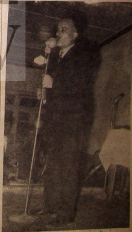
Türk-İş sabık Başkanı Nuri Beşer bir toplantıda konuşurken

Cam ve Camdanda meclis üyeleri arasında asgari ücreti tebliğ komisyonu 9 haziran perşembe günü saat 10 da Bolge Çalışma Müdürlüğü'nde toplanması ise de meclis üyeleri arasında Nuri Beşer'in istifası istenildi. Nuri Beşer'in istifası istenildi. Nuri Beşer'in istifası istenildi.