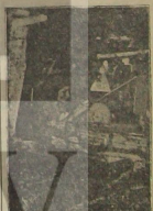
Değerli işçilerimiz, Şişe ve Cam Sanayi İşçileri Sendikası ile birleşme talefiyle, Şişe ve Cam Fabrikaları'na ve diğer kurumların işçileriyle bir araya gelerek toplantı yapmışlardır.