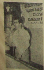
SİSİNDİRME İŞÇİLERİ SENDİKASI XURCULU KUTLUĞUNA Y 12297-1222

İstifa edenlerin yeniden işbaşta yapmalarını sağlandı