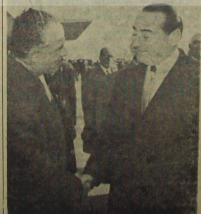
Başbakanlık Türk-İş İnceleme Biriminde

İl hakem kurulunun 12 Kasım'da yeni şekli ile faaliyet gösterdiği Çuhaklı Vakkı İleri tarafından İstanbul Çuhaklı (Devamu 2. sayfa)