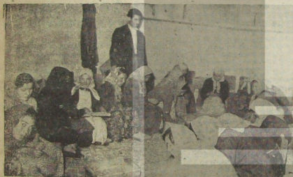
İşçiler fabrikada verilen ve istenen işi yapıyorlar