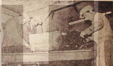
Harmann dairesinde Cam-karışık yarımadan teminlerken

Cam'ın fırınlarda eriyen muhtelif şekillerle sokulan maderinin hazırlamak baş-basına bir ültıs ve tek-niklik işidir.