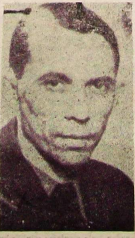
Yarıklı Teknik Direktör Gaddar

Makâmları; işçileri ve mesleki kollarındaki işçileri hakkıyla haklarını arayan teşkilatları yok makulayısıyla işverenlerin temin edilmiş memleketimizde sendikaları (Devamı 2. sayfalarda)