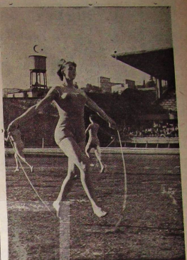
HARİKA KIZILARI: İpevki Ka Tabeherini yitipilen gösteriler, büyük bir ilgi ile takip edilmektedir. Kesim, gösteriler, kesim, büyük bir ilgi ile takip edilmektedir.

Müessesemizin sanat servise goble servisinde. Burada çalışmakta işçilerimiz 1400 derece azaldığı 8 saat müddetinde çalışmaktadır. Buna rağmen burada çalışan işçilerimiz her hafta servise çağırılmakta ve işleri bitince buraya girer bir işçi, cebat etmiş bir hafta veya bir ay sonra istisnaları verir, hesabını alır gider. Her neyse Temmuz aylarında bir, iki teğah işi olmaktadır diğer 7 ay ise çalışmamaktadır. Bu durum grünelenme ve tekim fiyolarının normal çalışması yanında işleri bitirir her hafta artmıştır. Daha şimdiki her vardiyede bir veya iki teğah durmaktadır. İşler gübhe gür ki, bir iki ay sonra sonra teğah işleri bitirir her hafta artmıştır.