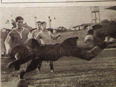
Adalet - Beyoğluspor maçından bir görüntü.