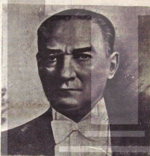
Cumhuriyetin kurucusu Büyük Atatürk

Gazetemizin ilk çıkışından bugüne kadar bizleri yardımlarını esirgemeyen işçi arkadaşlarımız ve 'Makale' sahiplerine teşekkürleri bir borç bilip ve gazetemizin auzun ömürlü olmasını dileriz.