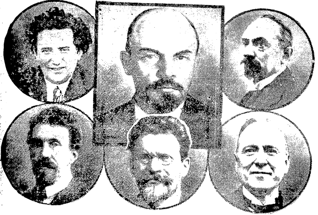
Bolşevik inkılâbını yapanlar [ortada: Lenin – sağında Çiçerin solunda Zinovyef. Alta sağdan sola: Rakofski, Kalinin, Rikof]