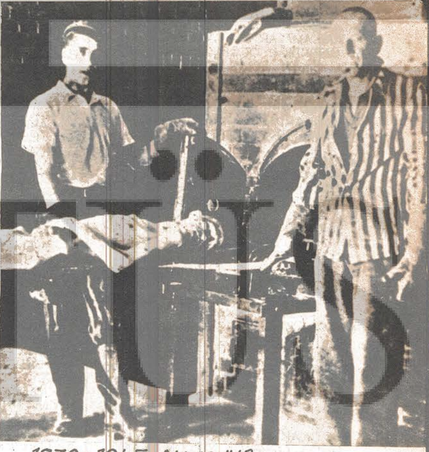
1938-1945 ALMANYA: İnsanlar gaz odalarında öldürülüyor, firmalara atılıyor.

Faşizmin bu görevini yerine getirirken kullandığı yollar nelerdir? Faşizm KAN üzerine kurulmuştur. Ama düzenini sürdürme, ve yıkılışını geciktirebilmek için çok ince yollara da bas vurur. Tank, top, işkence, zehirli gaz odaları, dar ağaçları, ve daha buna benzer yüzlerce zulüm aletlerinin yanında en büyük silahı propagandadır. Eline geçirdiği bütün yaygın araçları ile (Radio, Televizyon, gazeteler vs.) sürekli olarak aldatıcı, hedef sasırtıcı yayınlar yapar. Devletin, Miletin, yok olma tehlikesiyle karşı karşıya olduğunu, bütün sosyalistlerin, ilerçilerin yani halkın ne kadar gerçek dostu varsa hepsinin MİLLET DÜŞMANI olduğunu yaygın organlarında işler. VATAN EİDEN GİDİYOR sloganları atarak, kendi vatan halklarını gözlemeye çalışır. "Dürlü devlet" "asil millet" nutukları ile vatanın EMPERYALİST DEVLETLERE satışını gözlemeye çalışır. Faşizm, sömürge ve hatta kapitalizme karşı olduğu palavralarını yayıyor. Oysa kapitalizmin ta kendisidir. Bütün halkı bir avuç para babalarının çıkarı için soyup soğana çevirir.