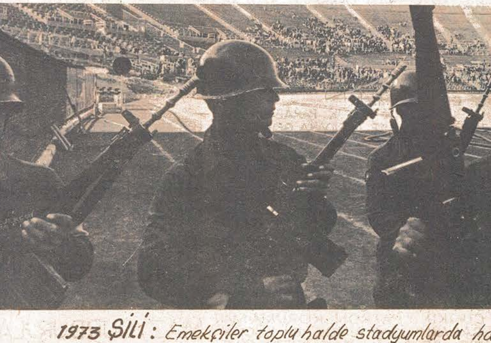
1973 Sili: Emekçiler toplu halde stadyumlarda hapsediliyorlar.

Her ülkenin çeşitli bakımlardan yapısı ayrıdır. Bu yüzden Faşizm de farklı ülkelerde değişik yollarla iktidara gelebilir. Bazen emekçilerin hatta işçi sınıfının çeşitli kesimlerini birbir türlü yollarla, onların baskıya ve sömürge karşı zaten var olan huzursuzluklarını kullanarak, onlara daha rahat bir hayat vaad ederek gelir; bazen darbeler, ihtilaller yolu ile gelir; bazen parlamentoyu ortadan kaldırır; olmazsa göstermelik bir şekilde var olmasına izin verir. Ama nasıl gelirse olsun Faşizmin görevi ve amacı: Bir avuç zenginin çıkarı uğruna, büyük halk çoğunluğunun sömürülmesini KAN, ATEŞ ve ZÜLÜM ile sürdürmek, KAPİTALİST DÜZENİN yıkılışını önlemektir. Her ülkenin çeşitli bakımlardan yapısı ayrıdır. Bu yüzden Faşizm de farklı ülkelerde değişik yollarla iktidara gelebilir. Bazen emekçilerin hatta işçi sınıfının çeşitli kesimlerini birbir türlü yollarla, onların baskıya ve sömürge karşı zaten var olan huzursuzluklarını kullanarak, onlara daha rahat bir hayat vaad ederek gelir; bazen darbeler, ihtilaller yolu ile gelir; bazen parlamentoyu ortadan kaldırır; olmazsa göstermelik bir şekilde var olmasına izin verir. Ama nasıl gelirse olsun Faşizmin görevi ve amacı: Bir avuç zenginin çıkarı uğruna, büyük halk çoğunluğunun sömürülmesini KAN, ATEŞ ve ZÜLÜM ile sürdürmek, KAPİTALİST DÜZENİN yıkılışını önlemektir.