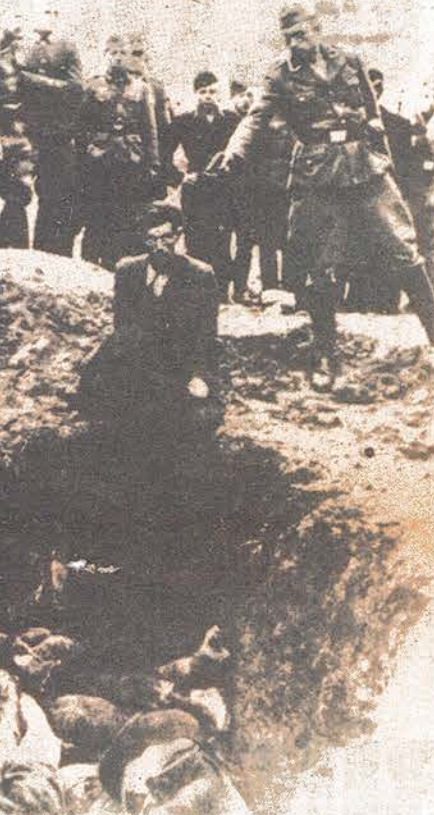
1940 ALMANYA: Faşistler emekçilere mezar kazdırıp, sonra onları MİLLİYETÇİ SOSYALİZM mezar başına KURBAN ediyorlar. LIST ilan eder.