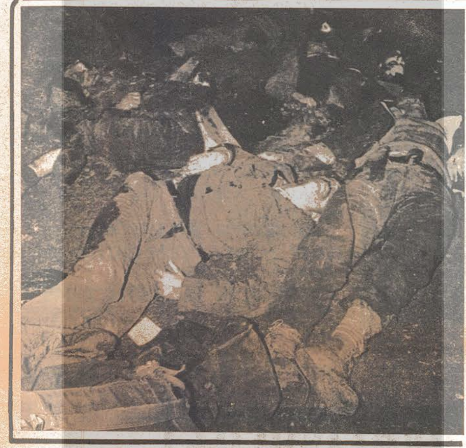
TÜRKİYE 1972 ...

1973 - Sili: Faşizm, kendisine hizmet etmeyen, bilimin, kitabın, düşünceyi DÜŞMANIDIR .