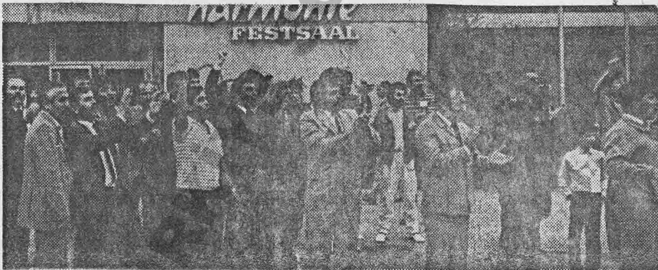
Mitglieder der „Türkischen Gemeinschaft“ protestieren vor der Harmonie gegen Demonstranten.