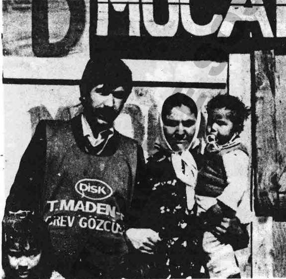
1979'da bir Maden-İş grevinden görüntü.

BİLİNCİLİ, KARARLI, SAVAŞKAN İŞÇİ SINIFIMIZ MESS'İ YENECEKTİR.