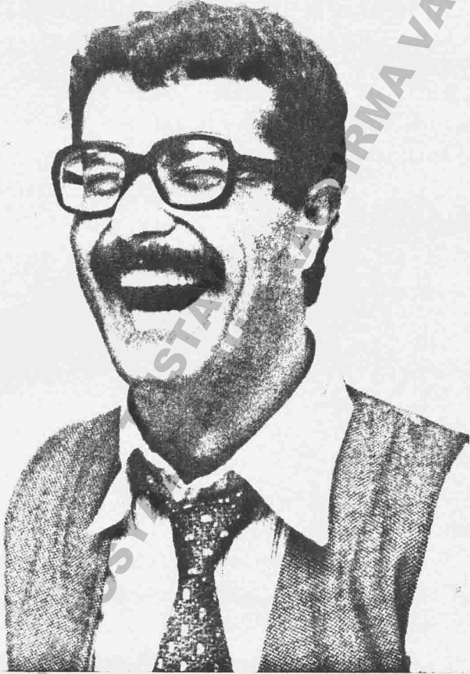
ENVER TÜRKOĞLU 1943 ...