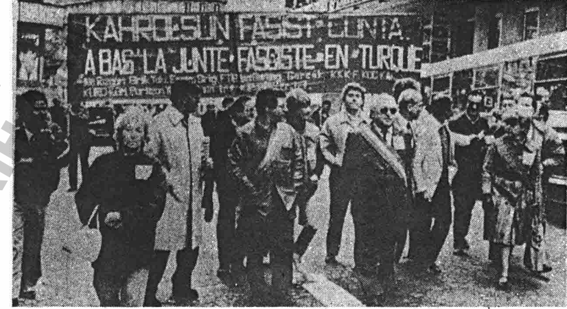
Fransa'da, 12 Eylül faşizmini protesto eylemlerinden biri.