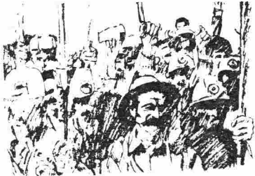
Simdi, gide aydin etme zamanidir. Yeni bir dunya doguyor. Sorul sorul giden kan paham. Mujdeler, mujdeler olsun Yeni bir dunya doguyor Zincir seslerinden Verem basitlerinden uzaktaki...

Tutuklu bulunan sendikacıların serbest bırakılması ve sendikalar üzerine konan yasağın kaldırılması, bizim somut talebimizdir. Kuşkusuz ki sendikal hak ve özgürlüklerin genel olarak savunulması ortak bazdır. Bu amaçlar çerçevesinde ortak ve özellikle dayanışma götürülmek istenen örgütün,(DİSK'in bu konuda görüşleri temel olmak üzere bir çalışma yürütülmelidir.