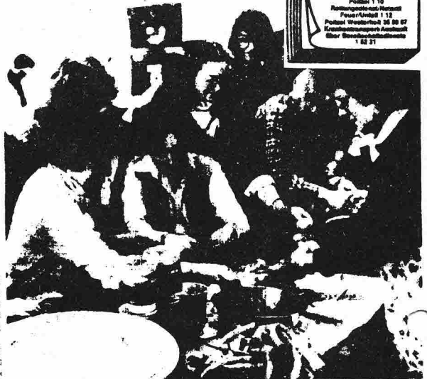
Mit Kostlichkeiten aus der eigenen Küche überraschten türkische Frauen die Besucher des Frauenfestes in der „Pappschachtel“.